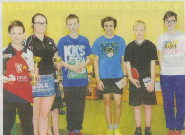
Uczestnicy ubiegłorocznego turnieju Jofrakudy w PSP 7