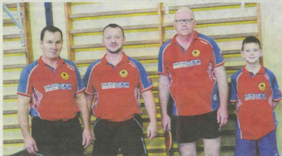
Zespół ligowy Jofrakudy Świebodzin przed meczem z Uczniakiem Henryków