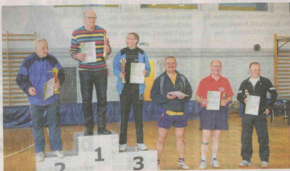
Oldboje Jofrakudy Świebodzin podczas dekoracji zwycięzców turnieju w Zielonej Górze.

17 kwietnia w Zielonej Górze zakończył się cykl turniejów o Puchar Prezydenta Miasta. Rywa-