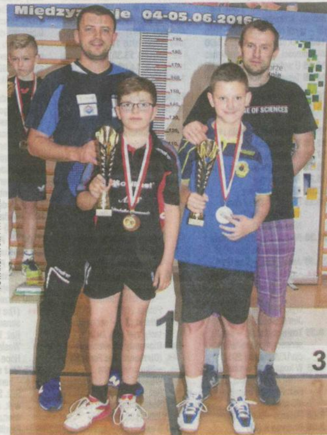
Lubuscy medaliści prezentują mistrzowskie trofea

Gratulujemy i dziękujemy młodemu zawodnikowi za godne reprezentowanie naszego miasta i klubu na forum kraju. ●