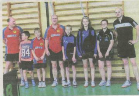
Trzeci zespół Jofrakudy Świebodzin z V-ligowymi rywalami

Ganesa Radoszyn rozegrał mecz z Czarnym Żagań. Wysoko wygrywając, a mówiąc żargonem