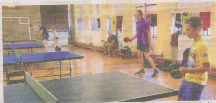
Sala gimnastyczna Zespołu Edukacyjnego w Łagowie gościła tenisistów KS Jofrakuda