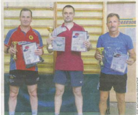
Zwycięzcy tegorocznego turnieju seniorów w PSP 7