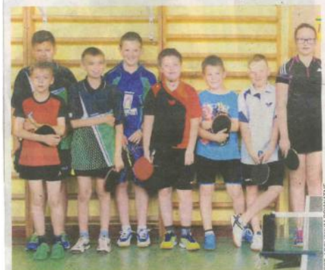
Uczestnicy turnieju tenisowego młodzieży w PSP 7

●● KS Jofrakuda jak co roku jest organizatorem turnieju tenisa stołowego z okazji Dni Świebodzina a sponsorem nagród urząd miasta w Świebodzinie.