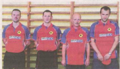
Zespół III-ligowy Jofrakudy Świebodzin