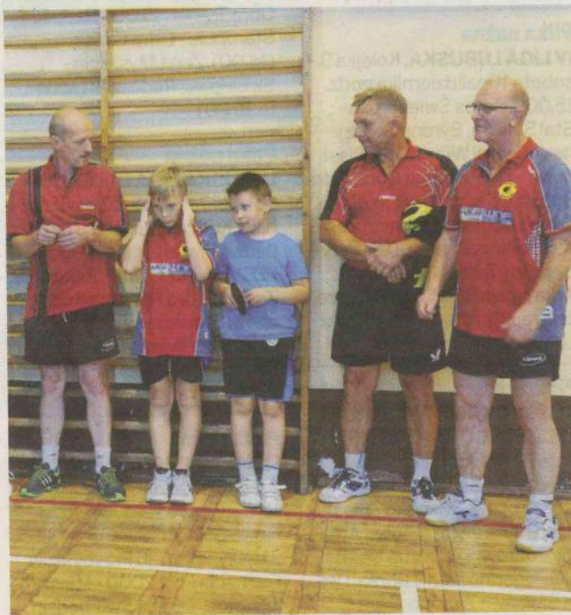
Pięcioligowy zespół KS Jofrakuda podczas wyjazdowego meczu w Żaganiu