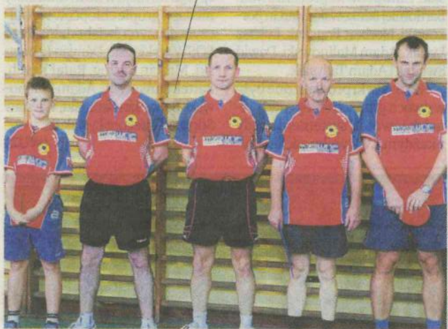
Pierwszy zespół Klubu Sportowego Jofrakuda Świebodzin