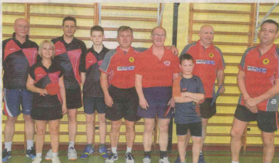
Trzeci zespół Jofrakudy Świebodzin rozgrywał w sobotę mecz z Tęczą Krosno Odrz.

W sobotę, 16 kwietnia, świąteczna Jofrakuda miała rozegrać mecz w Krośnie Odrzańskim. Ponieważ Tęcza miała trudności z uzyskaniem hali na spotkanie, poprosiła o rozegranie meczu w Świebodzinie. Drużyna z Krosna Odrzańskiego