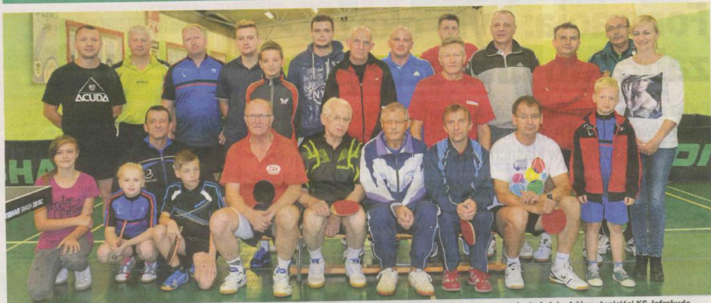
Uczestnicy turniejowego cyklu rozgrywek dla zaprzyjaźnionych klubów i środowisk pingpongowych w Opalenicy. Na pierwszym planie świebodzińscy tenisści KS Jofrakuda