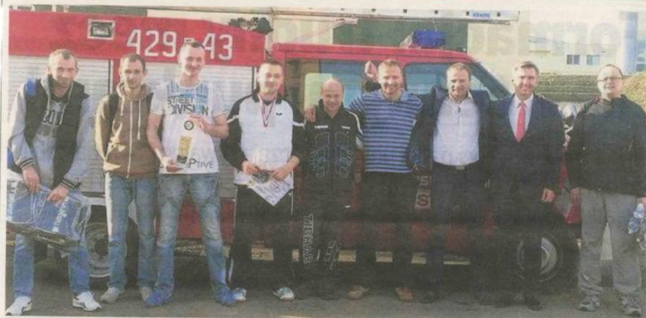
Wspólne zdjęcie zawodników z ministrem W. Sługockim i organizatorami na tle wozu strażackiego OSP ze Szczañca