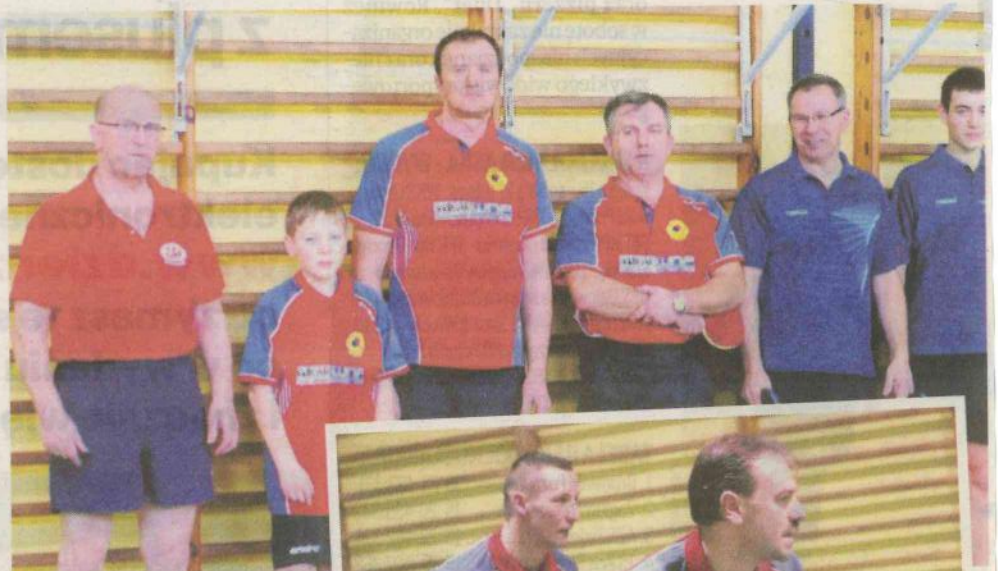
Jofrakuda III Świebodzin w meczu z wiceliderem

Ganesa Radoszyn grając na wyjeździe z drugą drużyną Tęczy od początku meczu postawiła wysoko poprzeczkę i spokojnie