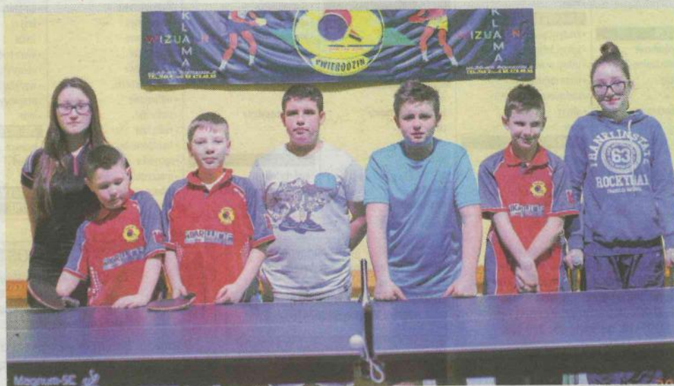
Przyszłość świebodzińskiego tenisa stołowego podczas treningu w sali PSP nr 7.

Trzynastego lutego rozegra no czwarty turniej w Nowej So-