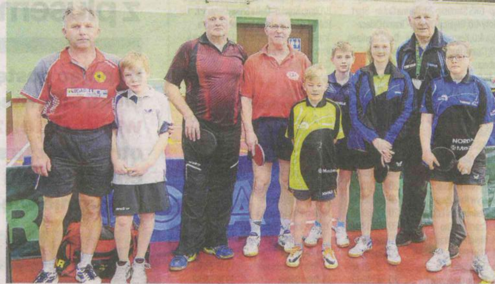
Trzeci zespół Jofrakudy Świebodzin rozgrywał w sobotę mecz w Drzonkowie

W meczach ligowych rozegranych zgodnie z terminarzem w sobotę (9 kwietnia), Jofrakuda I grając na wyjeździe przegrała 10:5, natomiast drugi zespół