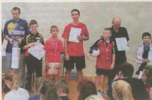
Tenisści stołowi Jofrakudy Świebodziń podczas oficjalnego zakończenia wojewódzkiego turnieju rodzinnego w Otyniu

W całym turnieju wygrał 7 pojedynków, a przegrał dwa (oba bardzo nieznacznie - na przewagi w czwartych setach) z zawodnikami odpowiednio z Bogorii Grodzisk Maz. oraz Lewarta Lubartów. Przy odrobinie szczęścia mógł się pokusić nawet o awans do czwartej czwórki. Jest to największy sukces tego młodego zawodnika, ale oczywiście liczymy na więcej - szczególnie na kończących sezon czerwcowych Mistrzostwach Polski w Międzyzdrojach. Igor Franc